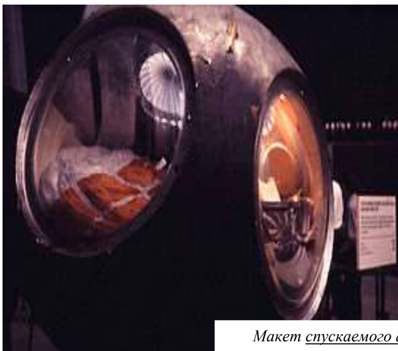
Макет спускаемого аппарата Ю. Гагарина