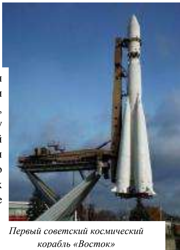
Первый советский космический корабль «Восток»

Полет, длившийся всего 108 минут, стал гигантским прорывом в истории космонавтики и сегодня в космосе уже тысячи спутников, космические аппараты совершали посадки на Луну и Венеру, началось активное изучение Солнечной системы. Первый полет человека был самым трудным и опасным, но стремление к покорению космоса многих тысяч людей, принимавших участие в подготовке полета, преодолело все преграды.